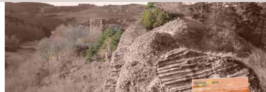
Coulées de Laffarre