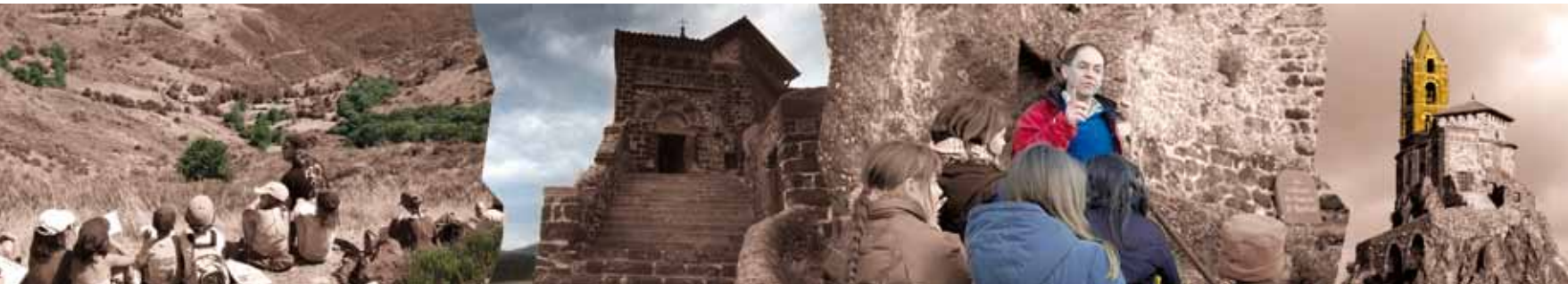
École du vent

OT de l'agglomération du Puy en Velay 04 71 09 38 41 www.ot-lepuyenvelay.fr