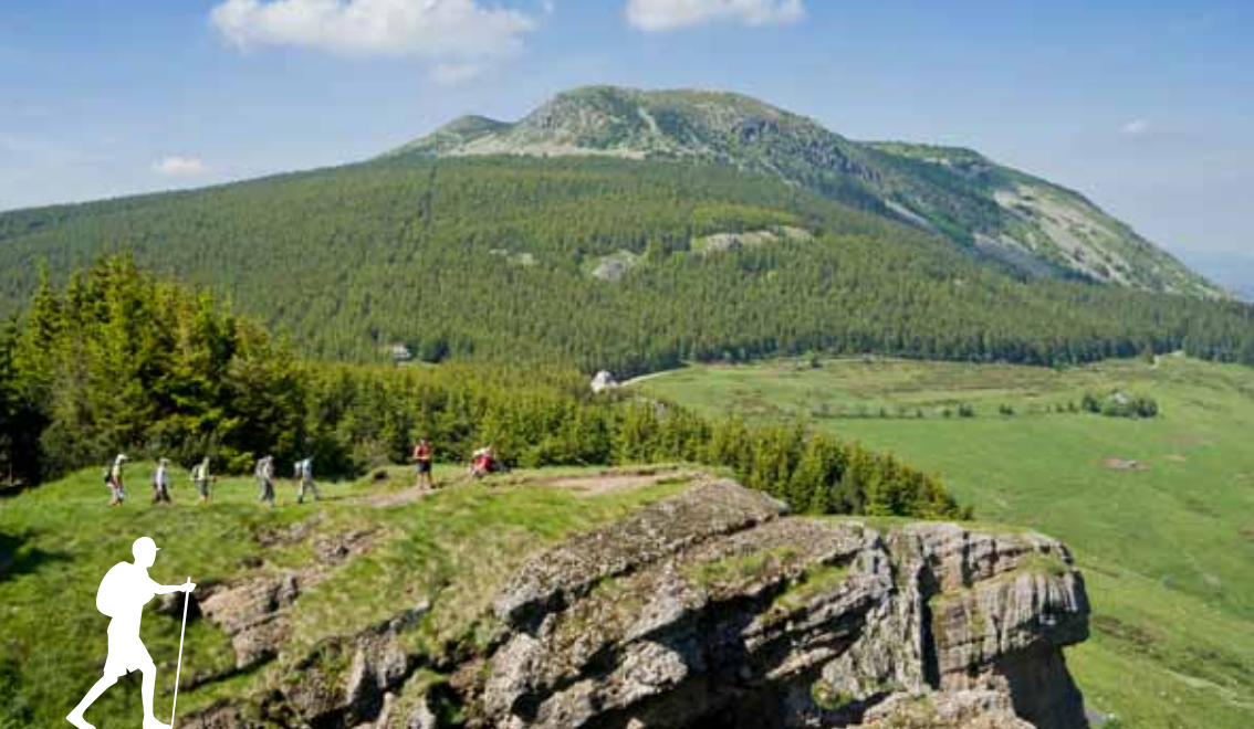
Cirque des Boutières