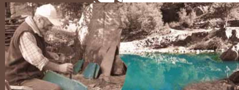
Un lauzeron du Lac Bleu

OT du pays du Mézenc et de la Loire Sauvage www.mezencloiresauvage.com Bureau d'accueil Les Estables 04 71 08 31 08 info@mezencloiresauvage.com Topoguide " Volcans des deux mondes " pour la balade géologique