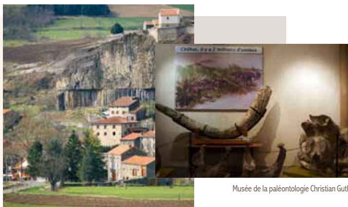
Orgues de Chilhac

mastodontes, rhinocéros, chevaux, cerfs, antilopes, ours, tigres, hyène, petit canidé, castor, porc-épic et trois espèces d'oiseaux. Une vidéo-projection retrace l'historique des fouilles et du Musée, les principales découvertes et le travail des paléontologues aussi bien sur le chantier qu'au laboratoire.